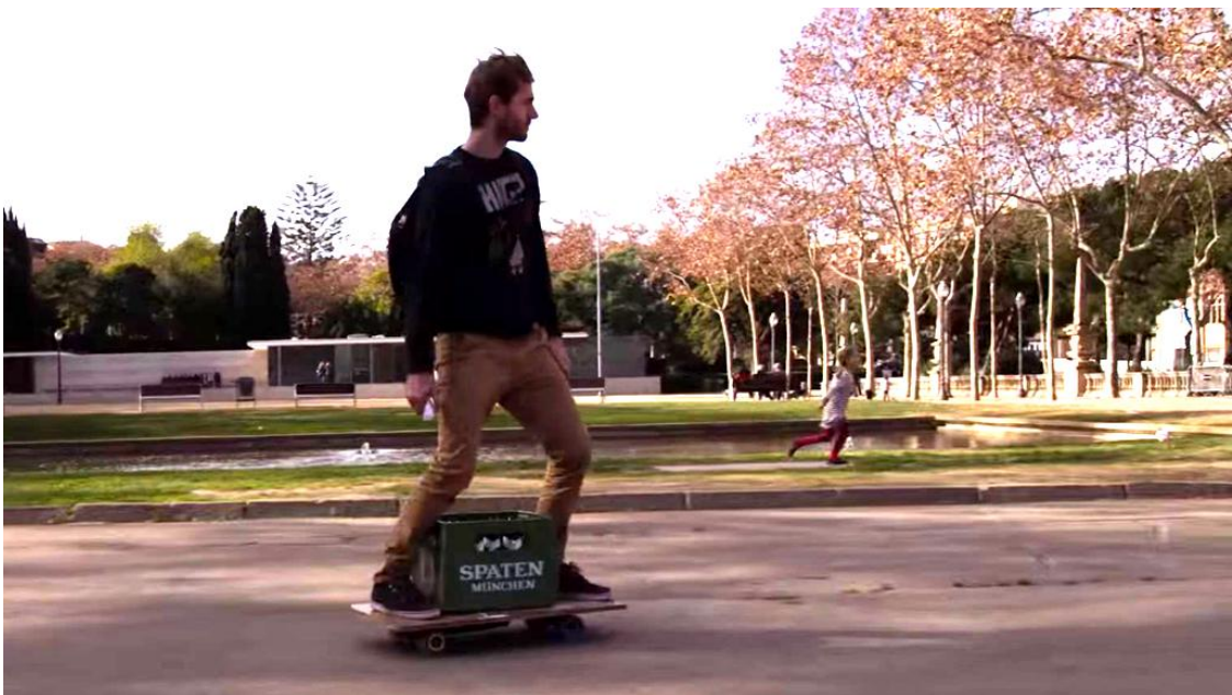
Abb.: Screenshot aus dem Beispielvideo