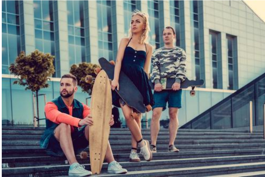
Abb.: Weibliche und männliche Skateboarder

Aber was ist mit jenen, die weiblich sind und das neue Selbstbewusstsein der modernen Gesellschaft in sich tragen, auch Skateboard fahren zu wollen? Die Rede ist von Frauen. Sie bringen auch Umsatz und könnten in einem Video oder Kapitel durch entsprechende Darstellerinnen angesprochen werden. Sie werden hier vernachlässigt, was per se nicht falsch ist, sofern die Entscheidung dafür auf einer bewussten Marktdefinition beruht.