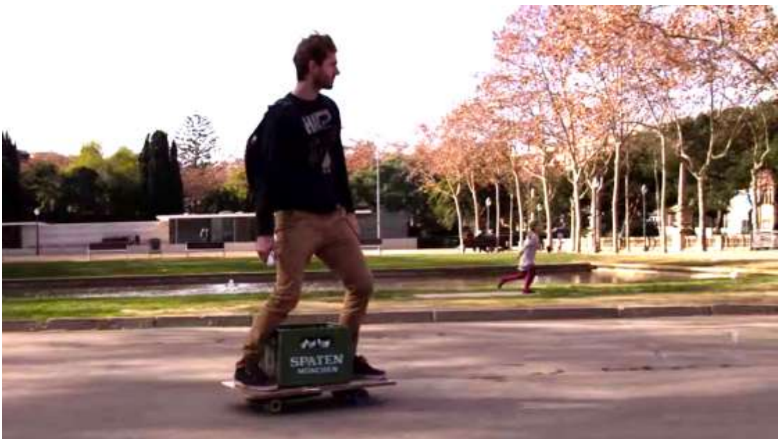
Abb.: Screenshot aus dem Beispielvideo