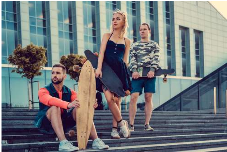
Abb.: Weibliche und männliche Skateboarder

Aber was ist mit jenen, die weiblich sind und das neue Selbstbewusstsein der modernen Gesellschaft in sich tragen, auch Skateboard fahren zu wollen? Die Rede ist von Frauen. Sie bringen auch Umsatz und könnten in einem Video oder Kapitel durch entsprechende Darstellerinnen angesprochen werden. Sie werden hier vernachlässigt, was per se nicht falsch ist, sofern die Entscheidung dafür auf einer bewussten Marktdefinition beruht.